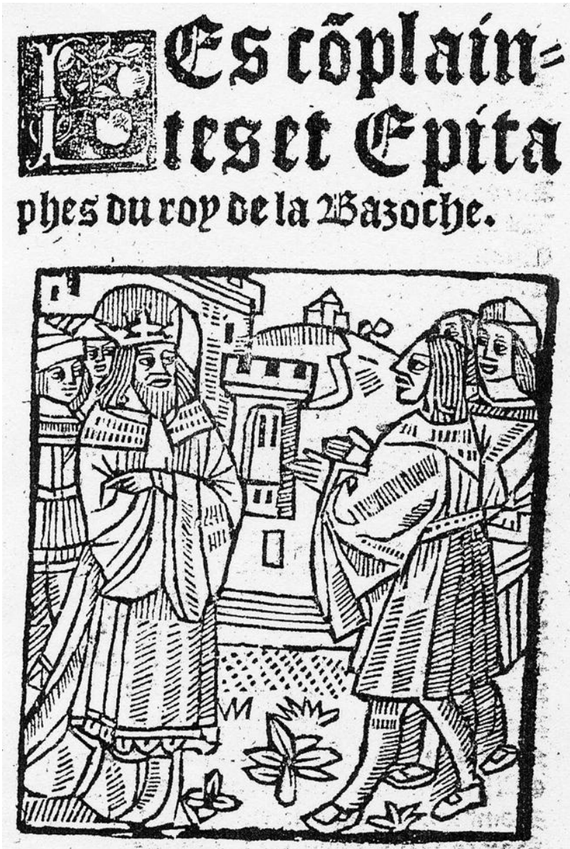
Fig. 2: Le roi de la basoche. Bois gravé de l'édition de 1520 des «Complaintes et Épitaphes du Roy de la Bazoche» d'André de la Vigne (1501).