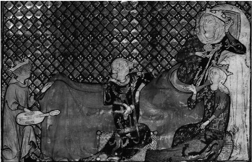
Fig. 1: Adenet le Roi. Paris, bibliothèque de l'Arsenal, ms. 3142, fol. 1.

la reine Marie de France, deuxième femme du roi Philippe III le Hardi (mariage en 1274), fille du duc Henri III de Brabant, et belle-sœur de Blanche de Castille. Soit elles écoutent Adenet en compagnie de Jean II de Brabant (neveu de Marie), soit Adenet écoute le récit des aventures de Cléomadès fait par Blanche 20 . La couronne d'Adenet, ainsi que son royal auditoire, évoque son statut de roi des ménestrels. Dans la lettrine située sous la miniature, Adenet est à nouveau représenté, non pas avec un instrument, mais en train de rédiger le roman sur des tablettes avec un stylet, les premiers vers prolongeant immédiatement l'initiale. C'est donc en trouvère, c'est-à-dire en auteur et exécutant qu'Adenet a été figuré 21 : il est le poète qui sait déclamer des vers et des histoires à son auditoire, avec ou sans instrument ; il est le lettré sachant trouver les vers, les écrire et les transmettre. La vièle est l'attribut du poète, elle est l'intermédiaire entre l'art d'écrire et la performance vocale du chant courtois. Tout au long du livre, le programme iconographique consiste à figurer le poète en train de déclamer le texte.