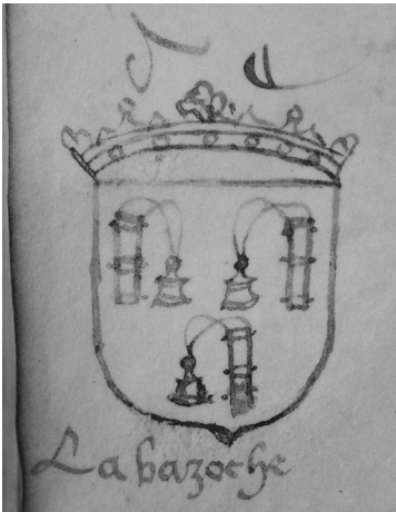
Fig. 1: Les armes de la basoche, dessinées dans la marge d'un registre du parlement de Paris (1528). Paris, AN, X1a 8345, fol. 255v.

D'autres basoches coexistent avec la basoche du Palais. On compte encore deux basoches parisiennes, celle du Châtelet et celle de la chambre des comptes. Une multitude