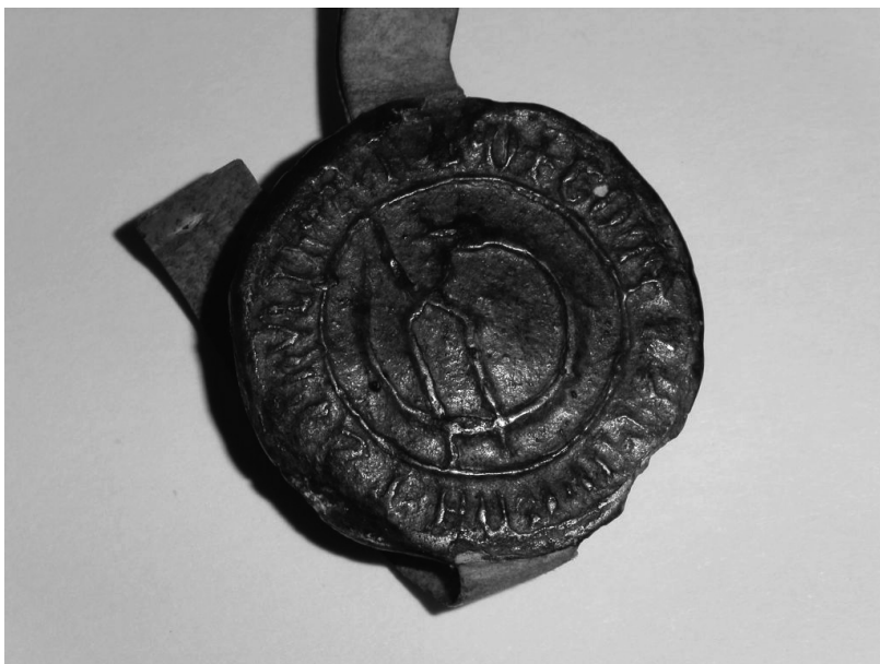
Fig. 1 und 2 (détail): Corporation des forgerons. Diplôme du 28 décembre 1412. Archives de la ville de Zurich, VII.179:1.3.