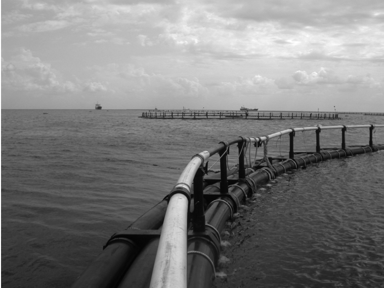
Vorrichtungen zur Thunfischzucht auf dem Mittelmeer

vom UNHCR, die während dieser Tage im ständigen Kontakt mit Kollegen in Rom und auf Malta standen und gemeinsam versuchten die Rettung der Migranten in Seenot in Gang zu bringen. Die Verzweigung der UNHCR-Mitarbeiter über die Lage auf See machte mir die Dramatik der Ereignisse auf dem Meer deutlicher bewusst.