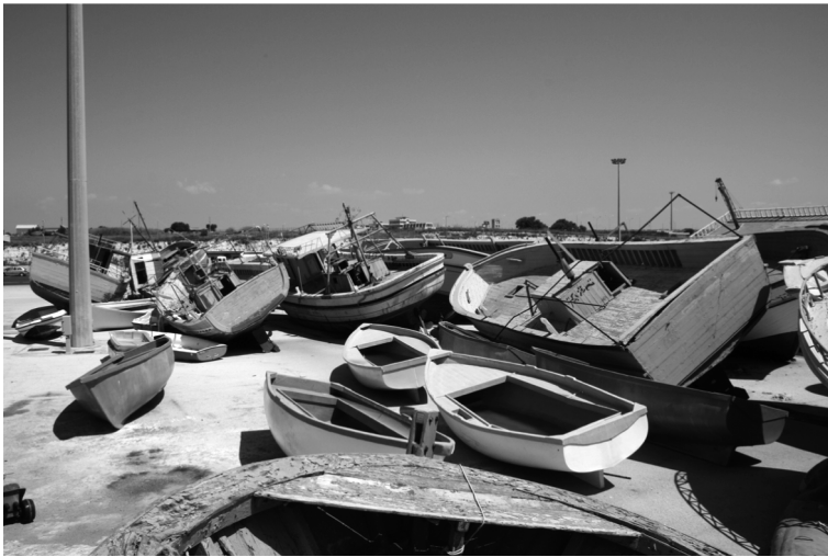
Migrantenboote im Hafengelände von Pozallo/Sizilien

ist einfach: Du fragst einen der hunderte Männer, die in dem Geschäft arbeiten. Zumeist sind es Männer aus Ghana. Wenn es losgeht, werden sie Dich anrufen, wenn Du in Tripolis wohnst. Wenn Du hingegen von auswärts kommst, wirst Du zumeist in einem Schuppen oder einem Haus außerhalb von Tripolis untergebracht, bis die Reise beginnt. Der Preis schwankt zwischen 800 und 1200 Dollar, das kommt aufs Boot und die Anzahl der Reisenden an. Außerdem werden sie einen Polizisten schmieren, damit er wegschaut, wenn ihr am Strand losfährt.“ 4 Obwohl ich gerne mehr Informationen sammeln würde, beschließe ich, mich in Libyen den Organisationen, die hinter den Bootsreisen stecken, nicht weiter zu nähern. Es erscheint mir zu waghalsig, weil es schon im Vorfeld meiner Reise immer wieder Hinweise gab, dass auch die libysche Polizei oder Regierung mit den Netzwerken, welche die Reisen organisieren, verbunden sind. 5