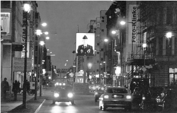
Abb. 9b: Frank Thiel, Übergänge , 1998

auch als individuelle Menschen, sie schauen gleichsam aus ihrer Uniform heraus, mit einem Blick, der die Rolle des Soldaten verläßt und sich an das menschliche Gegenüber, das des Fotografen beziehungsweise implizit das des Betrachters wendet.