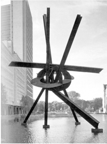
Abb. 10: Mark di Suvero, Galileo, 1996

Das Werk gehört zu den Skulpturen im Niemandsland Berlins der 1990er Jahre, auf dem die großen Firmen aus dem Westen ihre zentralen Berlin-Repräsentanzen errichteten, mit ihnen kamen bevorzugt Werke der großen US-amerikanischen Bildhauer nach Berlin. Es ist nicht erstaunlich, dass eine Profilbildung der Firmen nicht mit anspruchsvoller Architektur