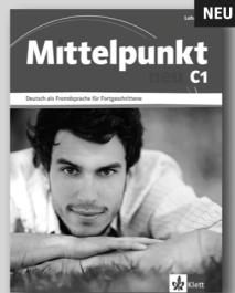
Mittelpunkt neu C1 978-3-12-676660-9