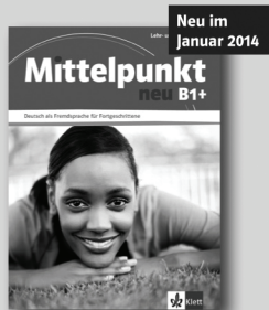
Mittelpunkt neu B1+ 978-3-12-676645-6

Komplett überarbeitete und erweiterte Ausgabe!