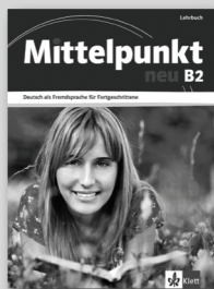
Mittelpunkt neu B2 978-3-12-676652-4