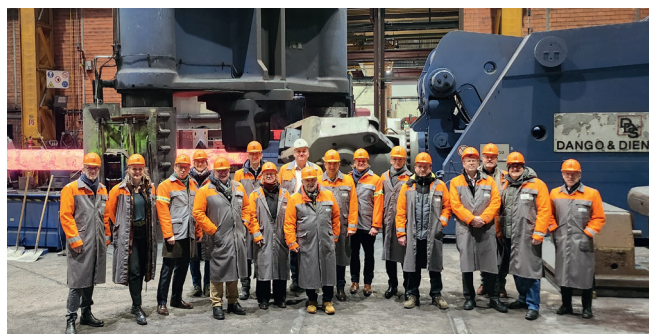
Die Mitglieder des AWT-Vorstands und -Verwaltungsrats am 4. Februar bei der Betriebsführung bei den BGH-Edelstahlwerken in Siegen.