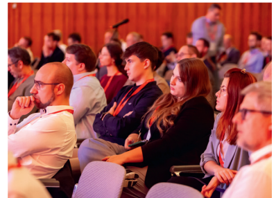
HK 2025 in Wiesbaden

Arbeitsgemeinschaft Wärmebehandlung + Werkstofftechnik e.V.