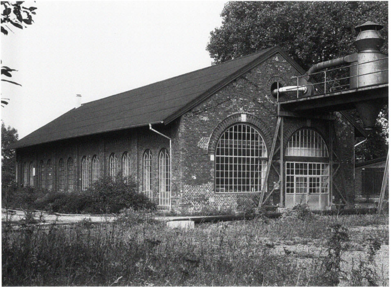
5. Minden, Lokschuppen II der Köln-Mindener-Eisenbahn von 1847 auf dem Gelände des ehemaligen Bahnbetriebswerkes an der Friedrich-Wilhelm-Straße 6

die genannten Daten und Begründungen schon wenige Jahre später nicht mehr den Tatsachen. 1993 wurde im Zusammenhang mit der Stadtforschung Minden eine Bauforschung vorgenommen, die Erstaunliches hervorbrachte. 63 Der heute als einheitlich erscheinende Bau besteht aus drei Teilen, einem vorderen, im Jahre 1500 errichteten Abschnitt, einem rückwärtigen, 1649 errichteten Bau und einem Obergeschoss mit Dachwerk von 1776. Auch das ist noch eine oberflächliche Beschreibung, denn die Analyse der 1649 und 1776 verbauten Hölzer konnte jeweils zuvor bestehende Bauteile nachweisen, etwa ein schon 1648 ersetztes älteres Lagerhaus von 1472. Die erarbeitete Baugeschichte kann zwar als bauforscherische Methodenspielerlei abgetan werden, doch erhielten die in dem heutigen Bau verbauten Hölzer eine weitere und für die Baugeschichte wesentliche Bedeutungsebene, denn sie erweisen sich als eine materielle Quelle von