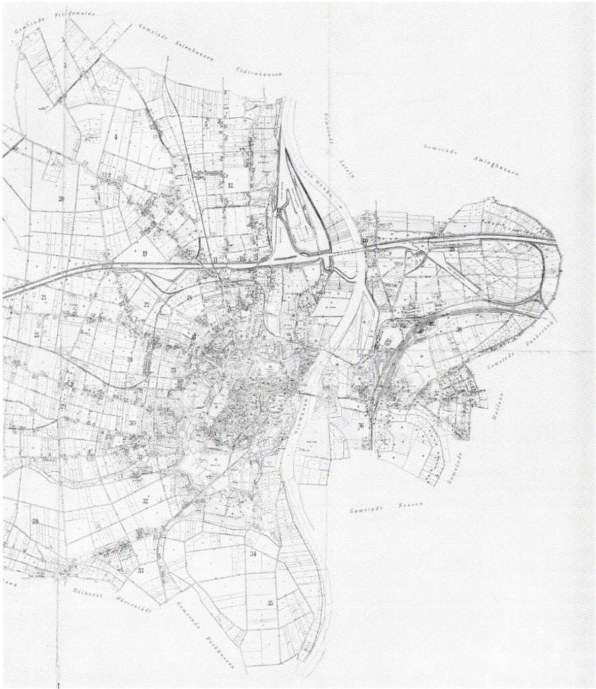
1. Der Stadtplan von Minden aus dem Jahre 1916 gibt Umfang und Stand der Bebauung des durch die Stadtforschung für das Inventar der Stadt Minden untersuchten Gebietes wieder

Wenn wir vor dem damit angesprochenen Hintergrund den Faden mit einigen Überlegungen weiter-spinnen, so stellt sich folgende Frage: Wo wird eigentlich eine methodisch weitergehende Diskussion um das geführt, was unter der Tätigkeit »Inventarisierung«