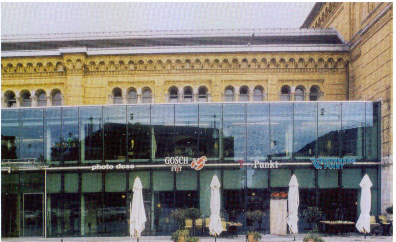
Hannover, Hauptbahnhof. Ansicht vom Bahnhofsvorplatz, 2001