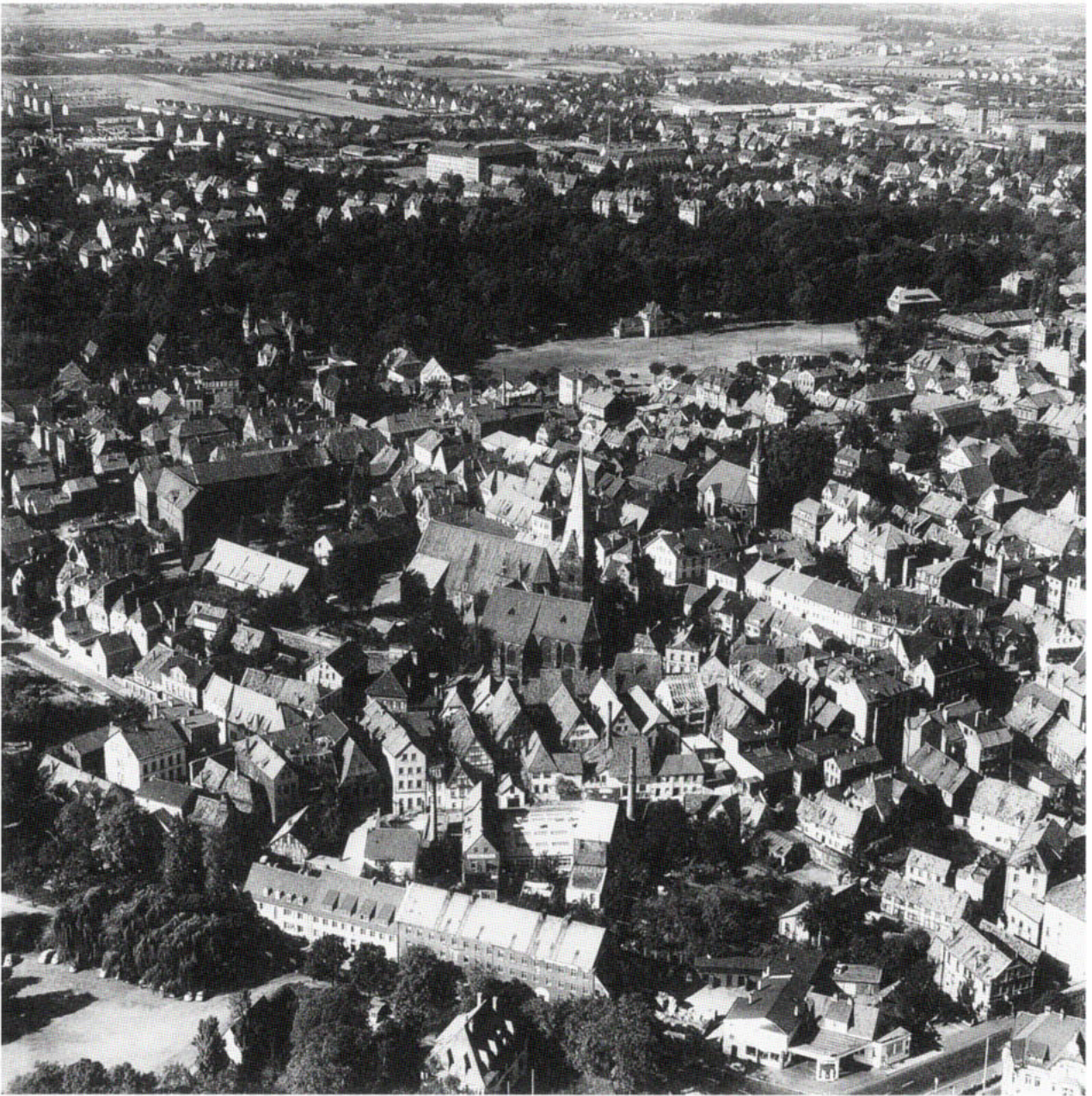
2. Flugbild der Innenstadt von Minden 1956. Blick von Südosten über die Altstadt mit St. Simeon in der Mitte, dem ehemaligen Festungsgürtel und den Stadterweiterungen ab 1873 dahinter

men wir zu den Objekten des gesetzlichen Erhaltungs-Interesses bzw. den Schutzobjekten und wie kommen wir zu einer Definition ihrer Bedeutung? Wer von uns kontrolliert die Schlüssigkeit der erarbeiteten Ergebnisse – und wie? Es ist nicht die Frage, warum ein spezielles Objekt Denkmalwert hat und wie dieser definiert werden kann, sondern warum es