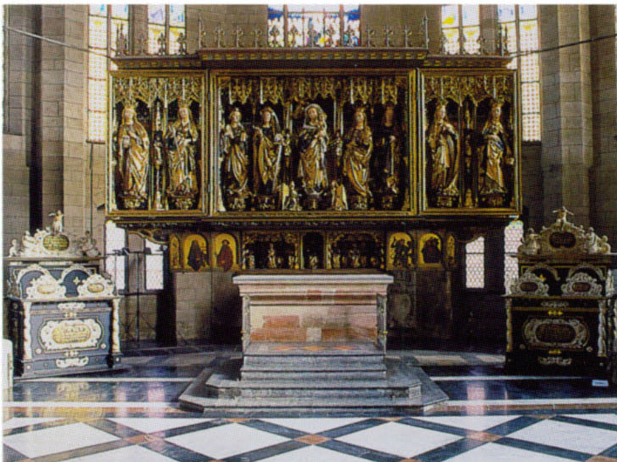
Zwickau, St. Marien, Wolgemut-Altar (1479) nach der Restaurierung des Schreins