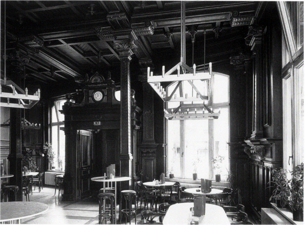
6. Minden, Markt 15. Der Schankraum des ehemaligen Gasthaus »Zum Stift« von 1886 ist mit der bauzeitlichen Einrichtung als »altdeutsche Bierhalle« erhalten geblieben

menstellung nicht bekannt sind, bestimmen die Inventare/Listen oder Verzeichnisse schon die Ergebnisse vorweg.