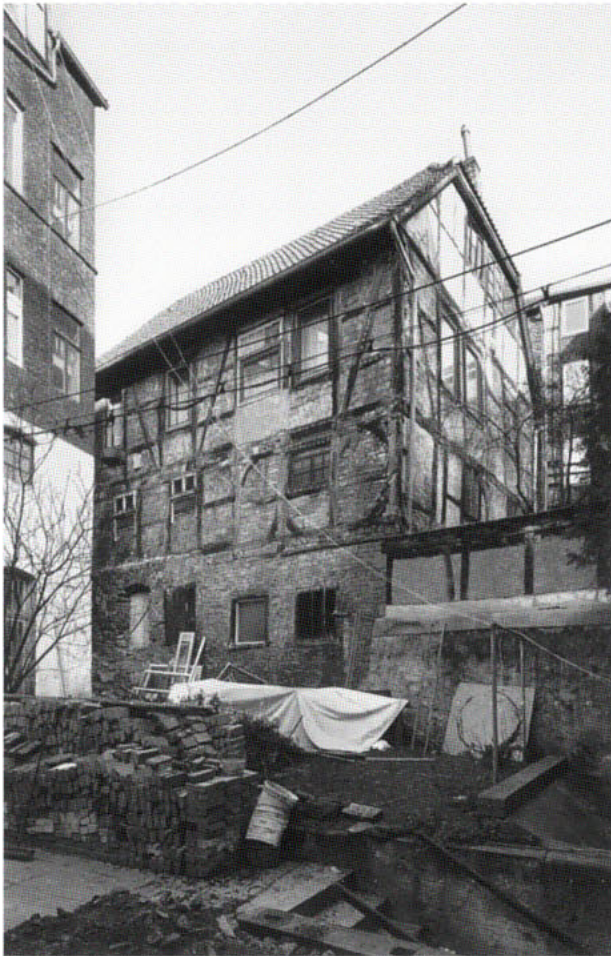
3. Minden, Lagerhaus hinter Markt 14. Der heute in seiner Gestalt durch einen Umbau von 1776 bestimmte Komplex entstand in mehreren Bauphasen ab der Mitte des 15. Jahrhunderts. Entwicklung und Bedeutung konnten durch Kombination von Bauforschung und archivalischen Quellen ermittelt werden

Es ist verständlich, dass der Anspruch, der hier eingefordert wird, in den bestehenden wirtschaftlichen und politischen Zwängen, denen unser Handeln im Alltag ausgesetzt ist, zunächst kaum einlösbar ist. Diese Einsicht darf jedoch nicht dazu führen, das zuvor umrissene Problem erst gar nicht zur Kenntnis zu nehmen.