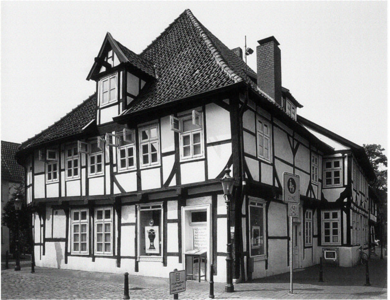
4. Minden, Baukomplex Alte Kirchstraße 1/1a. Durch Bauforschung konnte nachgewiesen werden, dass man den Kernbau von 1483, ein großformatiges Kornlagerhaus des Stiftes St. Martini, nach Ausbleiben der Pachteinkünfte um 1625 in zwei getrennte Wohnhäuser umbaute und später noch mehrmals veränderte

ne wird jeweils die bauliche Entwicklung einer zusammenhängenden Grundstückseinheit (in der Altstadt auch als Hausstätte bezeichnet) erörtert, da diese in der Regel eine funktionale Einheit bildet und die hier zusammenstehenden Bauten in ihrer Bedeutung in einem nicht nur räumlichen Bezugsrahmen zueinander stehen.