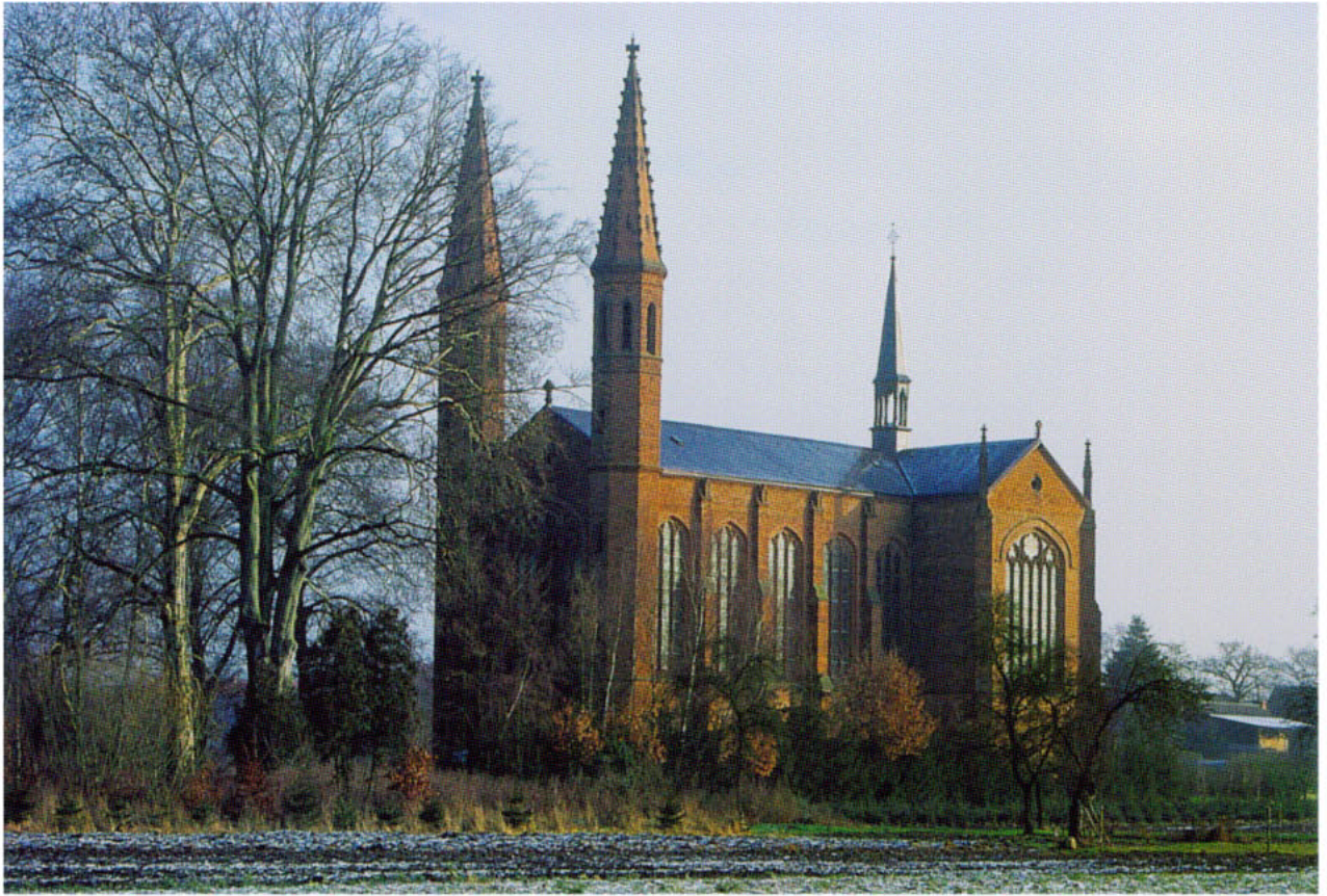
Letzlinger Heide, Schlosskirche