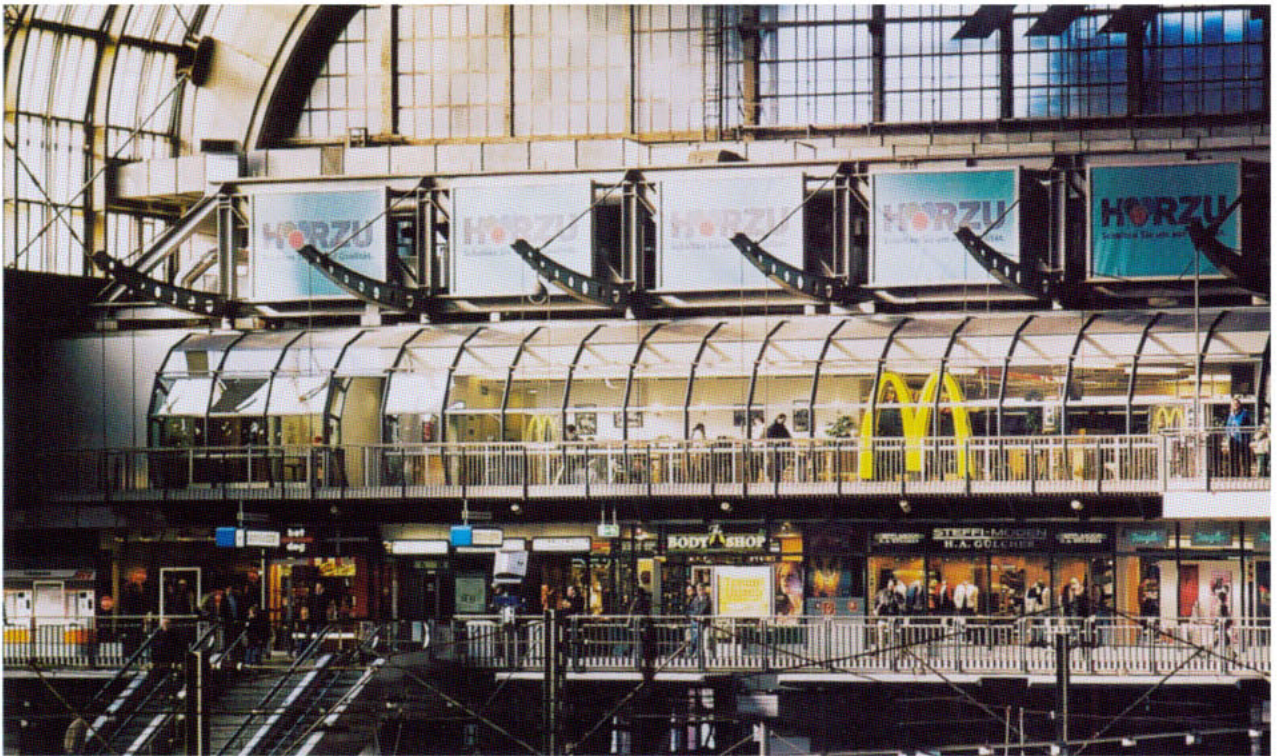
Hamburg, Hauptbahnhof. Einbauten mit teils leer stehenden Läden in der Halle, 2003