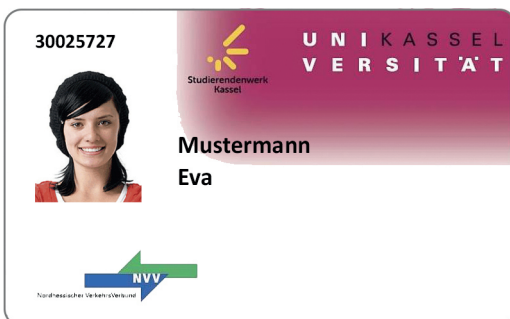
Abb. 3: Campuscard der Universität Kassel / Foto: Universitätsbibliothek Kassel.

Neben den vielen Änderungen und neuen Angeboten elektronischer Medien sorgte Corona dafür, dass zahlreiche weitere Optimierungen an der Universität