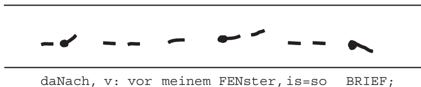
Abb. 1: Visualisierung der auditiven Analyse der Zeilen 242–244. 10

Einheit erhält, also prosodisch exponiert wird. Auf die Organisation der Information in drei prosodischen Einheiten wird in Abschnitt 2.3. noch genauer eingegangen.