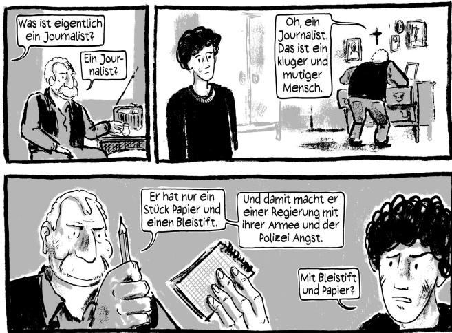
Abb. 3: (Schami/Rockstroh 2018: 10)

In dieser Hinsicht erlebt der Protagonist seine Leidenschaft für das Schreiben auf eine komplexe und zugleich kontrastreiche Weise. Auf der einen Seite hegt er den Wunsch, Journalist zu werden (»Das wäre schön, wenn ich Journalist werden könnte!« [Schami/Rockstroh 2018: 11, Abb. 4]).