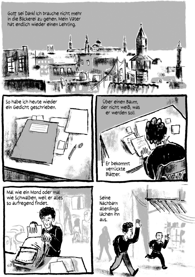
Abb. 6: (Schami/Rockstroh 2018: 2)

Doch Herr Katib ermuntert ihn nicht nur, Gedichte zu schreiben, wie beispielsweise das Gedicht über den Baum, »der nicht weiß, was er werden soll« (Schami/Rockstroh 2018: 22, Abb. 6), womit er zugleich auch seine Persönlichkeit auf poetische Weise zum Ausdruck bringt: