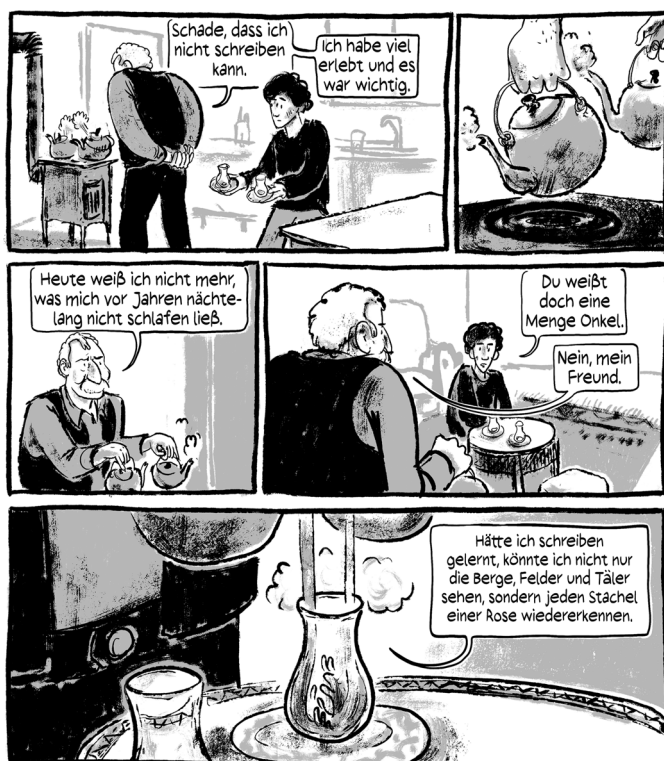
Abb. 1: (Schami/Rockstroh 2018: 6)

Dies wird bereits auf der ersten Seite manifest, als sich der Bäckerjunge mit seinem Onkel, dem Geschichtenerzähler Salim, über das Schreiben unterhält (Abb. 1). 6