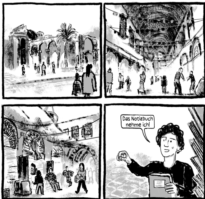
Abb. 2: (Schami/Rockstroh 2018: 9)

Dass die Aktivität des Schreibens eines Journalisten mit besonderen Fähigkeiten verbunden ist, die insbesondere in politisch so schwierigen Kontexten wie denjenigen, die in Syrien vorherrschen, Mut erfordern, erfährt der Protagonist ebenfalls im Gespräch mit seinem Onkel Salim. Indem das Schreiben nicht allein als poetisches Ausdrucksmittel dient, sondern »Bleistift und Papier« (Schami/Rockstroh 2018: 10) zu einer für die Macht bedrohlichen Waffe werden können, erhält es eine ausgesprochen politische Funktion, für Wahrheit und Freiheit und damit gegen das Regime zu kämpfen (Abb. 3).