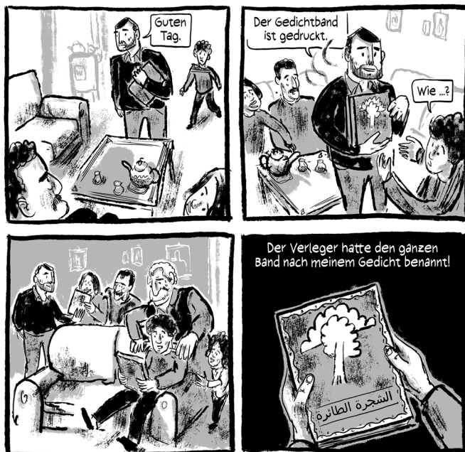
Abb. 7: (Schami/Rockstroh 2018: 75)

Unbeirrt verfolgt der Bäckerjunge das Ziel, »Journalist [zu] werden, die Wahrheit [zu] suchen« (Schami/Rockstroh 2018: 93), und richtet damit sein journalistisches Schreiben zunehmend dezidiert gegen die von der Militärdiktatur ausgeübten Ungerechtigkeiten und politischen Verfolgungen, denen auch sein Vater sowie der Geschichtslehrer zum Opfer fallen. Mit Hilfe seines Freundes Mahmud und des Journalisten Habib gründet er im Untergrund die sogenannte »Sockenzeitung« Der Funke (Schami/Rockstroh 2018: 94). Jede Ausgabe behandelt sieben Fragen, eine Frage für jeden Wochentag, die auf Papierstreifen geschrieben, in Socken versteckt und auf diese Weise auf dem Bazar unbemerkt in Umlauf gebracht werden (Abb. 8).