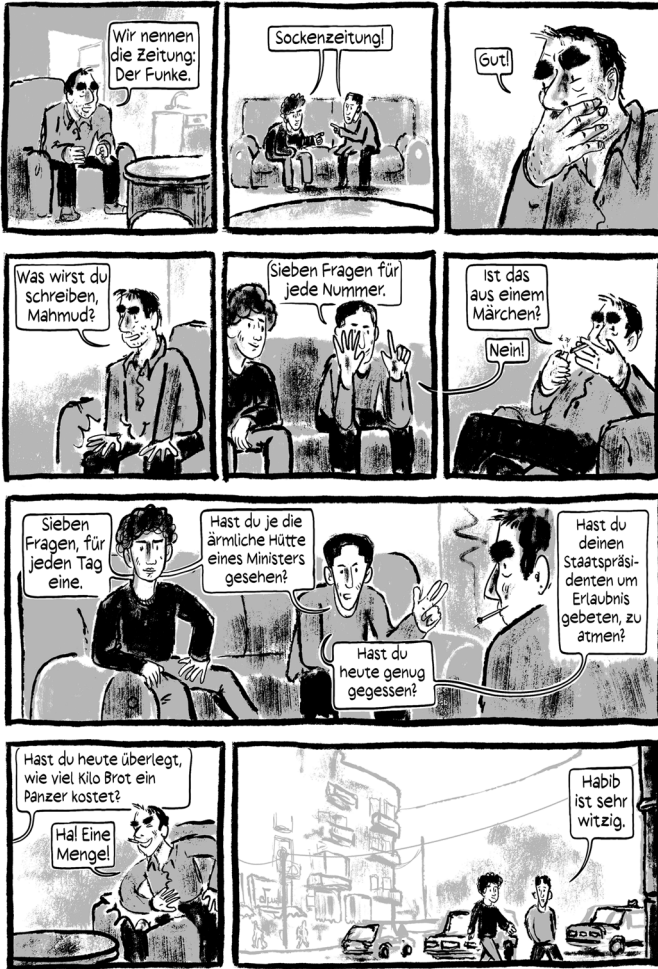
Abb. 8: (Schami/Rockstroh 2018: 94)

In kürzester Zeit erreichen die kritischen Artikel nicht nur landesweit eine immer größere Leserschaft, sondern auch im Ausland berichten die BBC London , »die Sender Israel und Jordanien« (vgl. Schami/Rockstroh 2018: 104) von der mutigen Aktion, sodass die jungen »Sockenjournalisten« ernsthaft Gefahr laufen, vom syrischen Geheimdienst aufgespürt zu werden. Durch den zunehmenden Druck sind sie gezwungen, ihre Kreativität immer weiter auszubauen und Alternativen für die Verbreitung ihrer Artikel suchen, die sie beispielsweise im Einwickelpapier der Orangen verbergen oder durch Luftballons verstreuen (Abb. 9 und 10).