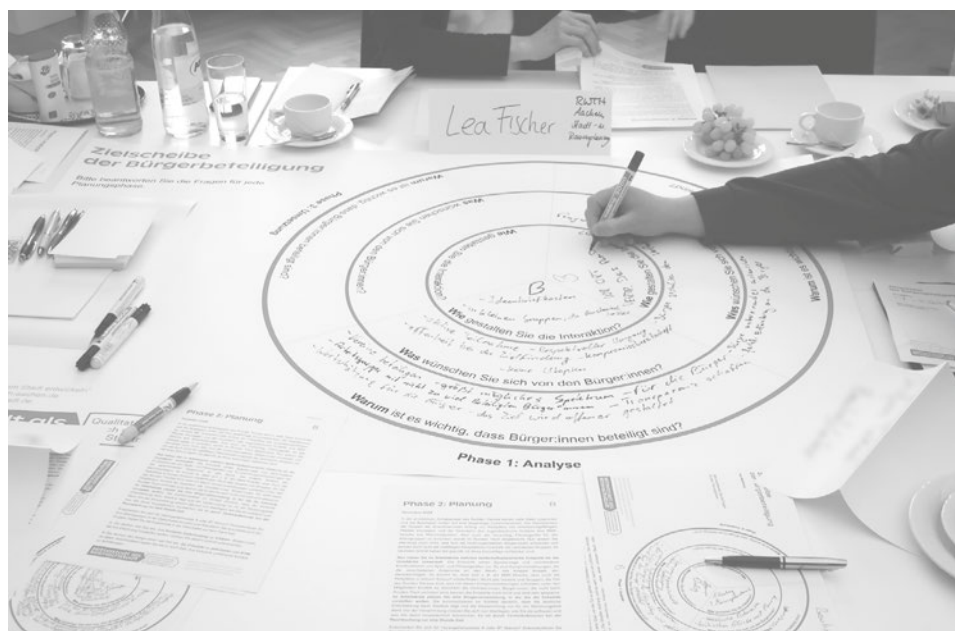
Abb. 03 Reflexion über Ziele der Bürgerbeteiligung mithilfe der Zielscheibe im Planspiel.