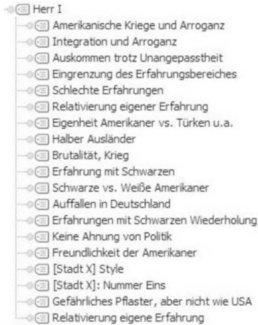
Abbildung 5: Beispiel einer einzelfallspezifischen Sequenzierung des Interviewmaterials (Screenshot aus MAXQDA 11)

In einem zweiten Analyseschritt konnte anhand der sequenzierten Texte, noch auf Einzelfallebene verbleibend, eine erste Interpretation der Gebrauchsweisen der jeweiligen Amerikabilder generiert werden. In den Termini der in Kapitel 2.4 beschriebenen Analyseheuristik gesprochen: Nachdem für jeden Fall die jeweils gebrauchten Amerikabilder gesammelt waren, wurde nach deren spezifischem Gebrauch im weiteren Kontext des Interviewtranskriptes gefragt, um sich auf dieser Grundlage dem performativen Gehalt antiamerikanischen Sprechens zu nähern. 21