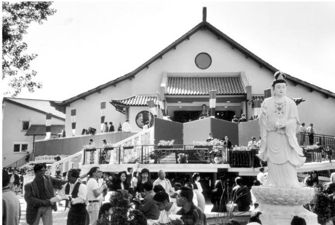
Abbildung 2: Pagode Vien Giac, Hannover. Blick auf die große Andachts-halle, rechts im Vordergrund die Statue des Bodhisattva Avalokiteshvara in weiblicher Gestalt als Kuan-ying (Vesakfest, Mai 1998).

Gewissermaßen unmerklich neben dem Rezeptionsstrang des in der öffentlichen Wahrnehmung dominierenden Konvertitenbuddhismus hat sich ein zweiter Buddhismus-Strang etabliert. Er ist in der Öffentlichkeit und der Forschung bislang nur wenig wahrgenommen worden. Dieser Strang wird durch Buddhisten und Buddhistinnen aus Asien gebildet. Ist der Buddhismus westlicher Buddhisten intern vielfältig und besteht aus Schulen und Traditionen aus Süd- und Ostasien sowie Tibets, so trifft dieses in ähnlicher Weise auf den Strang asiatischer Buddhisten zu. Sie kommen aus beinahe allen Ländern Asiens, in denen der Buddhismus die Mehrheit darstellt. Insgesamt dürfte die Anzahl asiatischer Buddhisten Schätzungen zufolge etwa 120.000 Personen umfassen.