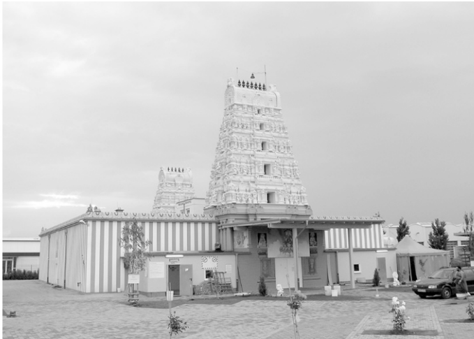
Abbildung 1: Der Sri Kamadchi Ampal Tempel in Hamm/Westfalen (Juli 2004).

tibilität« zu. Der Artikel vertritt die These, dass eine religiöse Differenz Prozessen gelingender Eingliederung nicht entgegenstehen muss.