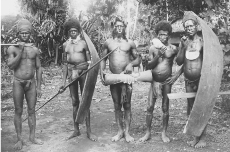
Abbildung 15: Bukaua-Krieger