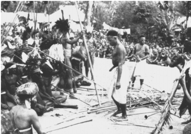
Abbildung 16: C. Keyßer (In: „Anutu im Papualande“, 1958) gab diesem Bild den folgenden Beitekt: „Heiden, die Christen werden wollen, legen öffentlich ihre Kriegswaffen und Zaubegeräte ab“ ( 96-97).

Der Stil Keyßers zeitigte – zumindest was die Zahl der Getauften anbelangt – Erfolg, und Stecks Untersuchung bestätigte das. Christian Keyßer könnte man mit Fug und Recht als den Spiritus rector dieses Missionswerks bezeichnen. Herwig Wagner (1992) erkennt in Keyßer einen „intuitive[n] Vorläufer der sogenannten kontextuellen Theologie“ (Sp. 1448).