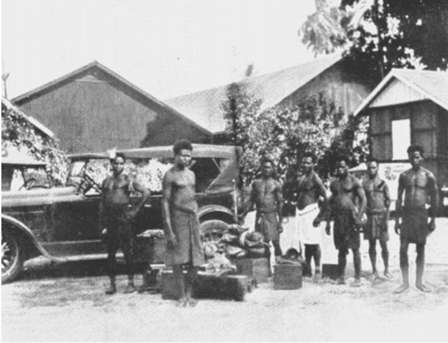
Abbildung 21: „Welche Eindrücke werden sie mit nach Hause nehmen? Abgelohnte Jungmannschaft in Rabaul“. F. Eppeling (1930: 8) gab dem Bild diesen Beitzext in seinem „Bilderbuch der Neuendettelsauer Mission“.

Diesen Aspekt der Solidarität mit den von Modernisierungsprozessen Bedrohten versteht Lehner als einen wesentlichen Teil seines Missionsauftrags, wie er ihn wenige Monate vor seinem Tod expliziert. In einem Vortrag weist er darauf hin, daß „ unser Bewußtsein der gleichen Schuldverhaftung vor Gott und des erfahrenen Erbarmens [...] uns dazu treiben “ muß, die Sorgen und Nöte der Melanesier als gleichwertig zu den eigenen wahrzunehmen und „ ihre Lasten auf unsere Schultern zu nehmen “ (1946: 2).