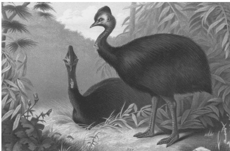
Abbildung 25: Helmkasuar (aus: Brehm 1882: 216-217)