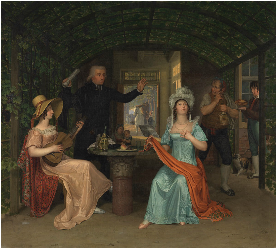
Abb. 1: Johann Erdmann Hummel: Die Fermate (um 1814). Bayerische Staatsgemäldesammlungen – Neue Pinakothek München.

Dass Lys' Gemälde genau wie Judiths nächtliche Inszenierung als Zitat eines romantischen Sujets verstanden werden kann, legt neben dem Schauplatz – die Spötter sitzen in einer römischen Villa unter einem Rebendach – vor allem die Personenkonstellation nahe: Zu den fünf Spöttern gehören ein „Taugenichts“ und „ein eleganter Abbé in seidener Soutane“. Im Verbund mit der Bemerkung, dass der Betrachter „sich am liebsten in das Bild hinein geflüchtet hätte“ erinnert dieses Ensemble an das römische Gartenfest in Eichendorffs Novelle Aus dem Leben eines Taugenichts , auf dem eine Gruppe deutscher Künstler das in E.T.A. Hoffmanns Erzählung Die Fermate beschriebene Gemälde Johann Erdmann Hummels (Abb. 1) als lebendes Bild nachstellt (Eichendorff 1985, 531).