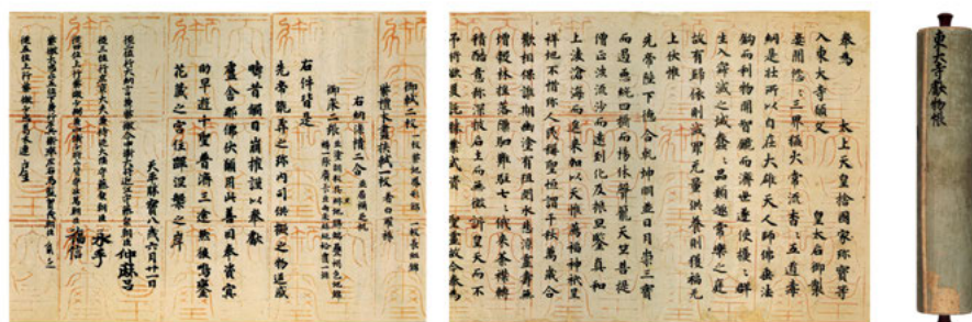
Abb. 2: „Stiftungsverzeichnis für den Tōdaiji Tempel“ (Tōdaiji Kenmotsuchō); auch als „Liste der seltenen Schätze des Reiches“ (Kokka chinpōchō) bezeichnet. Zinnoberrot und Tusche auf hochwertigem weißem Leinenpapier ( shiromashi ), Rollenenden aus Sandelholz in Form von Plektren, Querrolle, 25,8 × 1470,0 cm, datiert auf den 21. Tag des 6. Monats im Jahr 756. Nordspeicher des Shōsōin Schatzhaus, Nara, Japan. Außenansicht, Beginn und Ende der Querrolle. Die Dedikationschrift ist in chinesischen Zeichen im Stil der Sui-Tang-Zeit auf von kaiserlichen Siegeln in drei Registern bedecktem Leinenpapier geschrieben und enthält die Liste der gestifteten, mehr als 600 Artefakte umfassenden Schätze (aus Dai 42kai Shōsōin-ten: Exhibition of Shōsō-in Treasures , Nara: Nara National Museum 1990, Kat.Nr. 1).

hochrangigsten buddhistische Würdenträger aus Korea, China und sogar Indien an und brachten Schätze als Stiftungen für den Tempel mit. Auch Gegenstände aus Griechenland, Ägypten und Rom sowie der Seidenstraße sind in dieser Sammlung erhalten: Kleidung, Ritualobjekte, Luxusgegenstände wie persische Bronzevasen, Musikinstrumente, Waffen, Malereien, und zahlreiche Schriftstücke. 29 Hierzu gehört das Stiftungsdokument von 756, Listen von einzelnen Objektgruppen (etwa Musikinstrumente), und ein über 10.000 Schriftstücke umfassendes, sogenanntes Shōsōin-Archiv ( Shōsōin monjo ), das Dokumente ab 710 bis in das frühe neunte Jahrhundert enthält. 30 Darunter fällt auch ein 1988 ausgegrabener Fundkomplex von 226 beschrifteten Holzstäben (→Holz), der Aufschluss über das Bauamt des Tōdaiji Tempels ( zōtōdaijishi ) gibt. Unter den Schriftstücken sind sowohl administrative Inhalte, wie Steuern aus den verschiedenen Regionen ( Seishū ), chinesische Gedichtsammlungen, chinesische Abhandlungen über Musik, oder buddhistische Sakraltexte, wie Sūtren, (z. B. das Bonmyōkyō , das sich auf Vairocana-Buddha bezieht) erhalten.